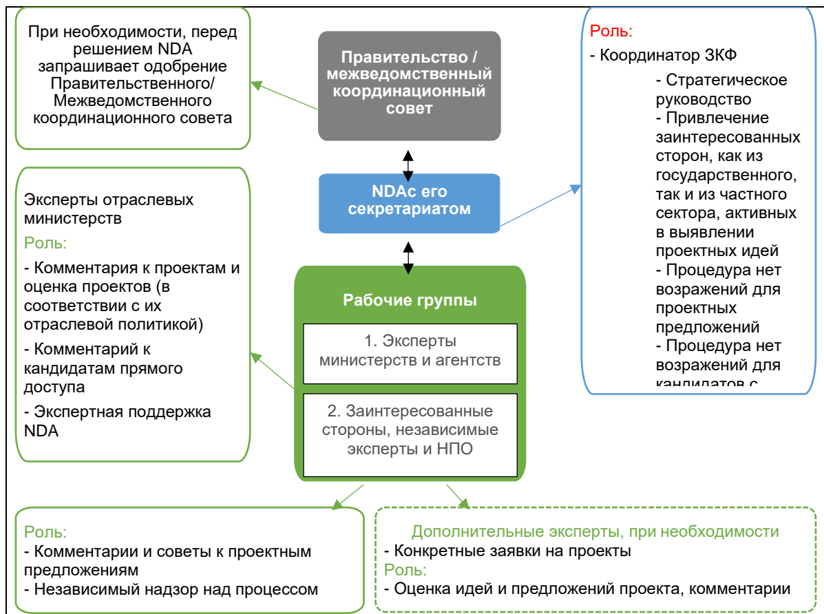
Рисунок 1: Схема координационного механизма ЗКФ в Таджикистане 5