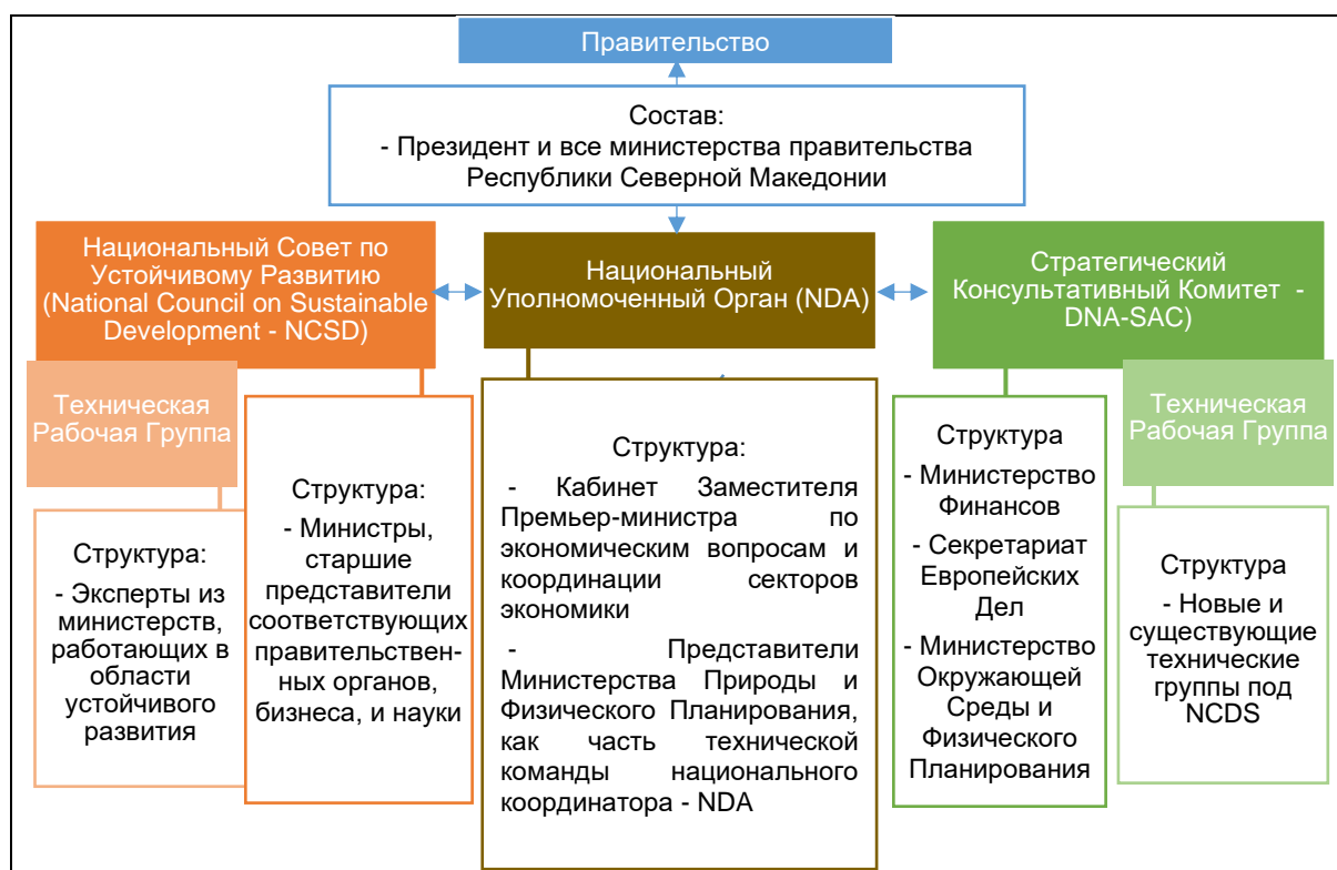
Рисунок 1: Структура координационного механизма ЗКФ в Республике Северной Македонии